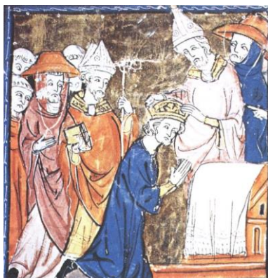
Στέψη του Καρλομάγνου. Μικρογραφία σε χειρόγραφο.